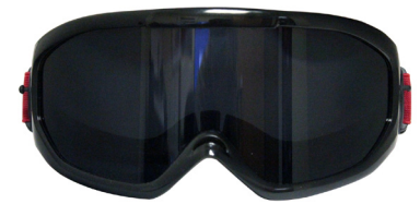
Gafas de Configuración de Noche Num 14402: .06 - .08 BAC Num 14404: .15 - .25 BAC