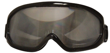
Gafas de Configuración de Día Num 14401: .04-.06 BAC Num 14403: .08-.15 BAC Num 14405 .26 -.35 BAC

Ahora están disponibles en cinco configuraciones diferentes de BAC y otra que simula el deterioro por las drogas. Las gafas Drunk Buster son los más asequibles y las gafas más finas en el mercado. Todas las gafas incluyen una bolsa de tela para su transporte y protección, una guía del instructor y una garantía de 5 Años.