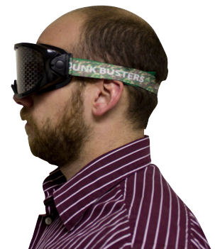
Gafas que Simulan Las Drogas Num 14406: Efectos de Drogas